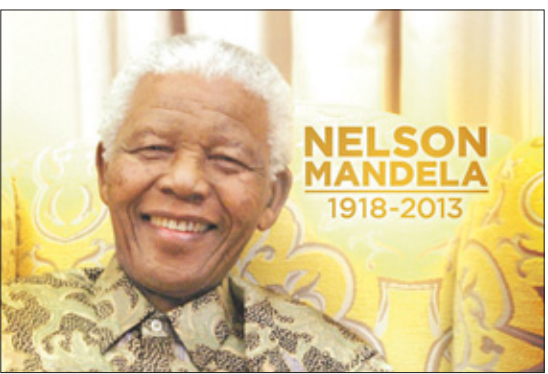
In tegenstelling tot Suriname werd in Zuid-Afrika de Waarheids- en Verzoeningscommissie ingesteld onder de regering van Nelson Mandela, niet onder een regering van een president die verantwoordelijk was voor misdrijven tegen de menselijkheid.

„Manipulatie van de waarheid leidt niet tot het ontbreken van waarheid, het is erger dan geen waarheid. Gemanipuleerde waarheden helpen de machtigen, of versterken de posities van de mensen die hen propageren.” - Ai Weiwei. „Waarheid is de vrucht van de tijd, niet van de autoriteit” - Francis Bacon. „Niet om oude wonden open te rijten, maar als een noodzakelijk middel om gerechtigheid, heling en eenheid te bevorderen.” - Paus Franciscus over de noodzaak van waarheid in verwerking mensenrechtenschendingen.