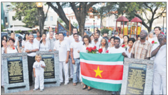
Toen hij in opruiende taal na zijn amnestiewet van 2012 tekeering tegen de duizenden demonstrerende 'volksvijanden', bagatelliseerde Bouterse het leed van de nabestaanden met '15 doden in 300 jaar'.

De architecten van de zelfamnestiewet kozen voor hun waarheidscommissie, in lijn met hun tactiek van geleend gezag, de naam van de waarheidscommissie van Zuid-Afrika. De suggestie van verwantschap was onwaarschijnlijk. De Waarheids- en Verzoeningscommissie in Zuid-Afrika was geen deel van een zelfamnestiewet. Daders konden pas na vertellen van de waarheid in aanmerking komen voor amnestie, terwijl strafrechtelijke vervolging van ernstige misdrijven niet werd uitgesloten. De Waarheids- en Verzoeningscommissie werd