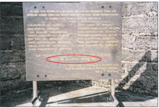
Op het Nationaal Monument Bastion Veere prijkt 'Recht en waarheid maken vrij'.