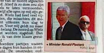
Minister Ronald Plasterk

Minister Ronald Plasterk (Binnenlandse Zaken en Koninkrijksrelaties) woonde woensdag de afscheidplechtigheid bij. Kort voor hij wees op het vliegtuig naar Nederland stapte, bevestigde hij de Nederlandse steun aan het rechercheonderzoek. Met hoeveel politiemensen ons land het team versterkt, wilde de minister niet zeggen. Alle hulp die Curaçao nodig heeft, zal worden gegeven, aldus Plasterk. Ik was echt geschokt door de moord, onder meer omdat ik Wiels goed kende. Ik kon goed met hem opschieten, ook op het persoonlijke vlak. We hebben regelmatig met elkaar gewaakt een charismatisch man die vocht voor zijn idealen.