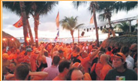
Bij Wet & Wild zag het oranje van de mensen.