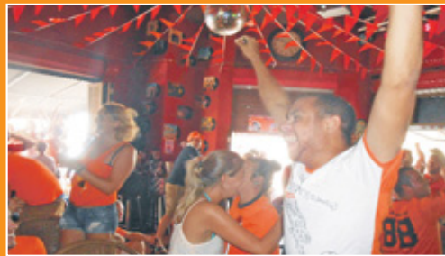
Café De Tijd ontplofte bij het derde doelpunt.

dat op verschillende Curaçaose radiozenders wordt uitgezonden. Degenen zonder beeld laten zich meedeinen op de klanken van de steeds feller wordende stem van Van Gelder. Bij de bushalte zit een groep mensen te wachten: „Wil je de radio wat harder zetten?“ wordt er gevraagd aan een wachtende chauffeur. De radio