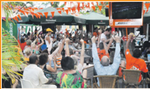
In Punda was het ook gezellig druk bij het Pleincafé Wilhelmina.

Even werden de voetbalfans gisteren vier jaar terug in de tijd geworpen, toen Nederland en Spanje elkaar tijdens de finale om de wereldbeker ontmoetten in Zuid-Afrika. Misschien is de spanning daarom ook wel zo groot