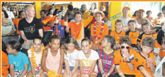
De jeugd was van de partij om Oranje te steunen.

WK-NIEUWS Oranje verplettert Spanje Mexico - Kameroen 1-0 Chili - Australië 3-1 Spanje - Nederland 1-5 MEER OP 34 EN 35