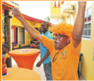
Juichend voor Oranje.