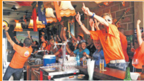
Op de BLVD voorspelden ze de 1-5. FOTO BLVD