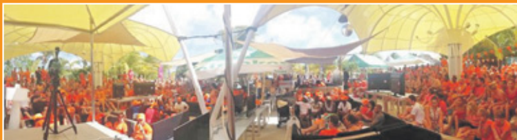
Bij Cabana Beach zagen tientallen supporters hoe Oranje won.

WK-NIEUWS Oranje verplettert Spanje Mexico - Kameroen 1-0 Chili - Australië 3-1 Spanje - Nederland 1-5 MEER OP 34 EN 35